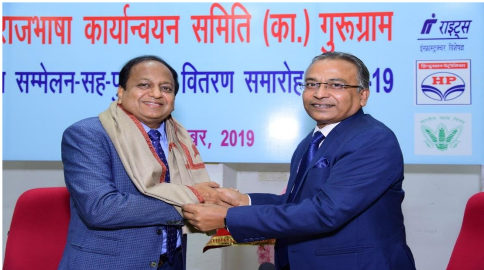
अध्यक्ष, नराकास का स्वागत करते हुए निदेशक (वा. व मा.सं.वि.), वापकोस लिमिटेड

समारोह के अंत में निदेशक (वाणि. व मा.सं.वि.) एवं अध्यक्ष, विभागीय राजभाषा कार्यान्वयन समिति, वापकोस लिमिटेड ने माननीय अध्यक्ष, नराकास, गुरुग्राम का सम्मेलन में पधारने व अपने प्रेरणादायक शब्दों से उपस्थित सभी अधिकारियों के ज्ञानोपार्जन के लिए तथा सभी सदस्य कार्यालयों द्वारा दिए गए सहयोग के लिए धन्यवाद दिया।