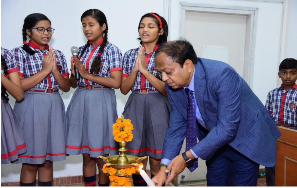
दीप प्रज्ज्वलन व सरस्वती वंदना