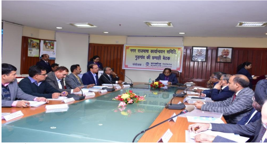
नगर राजभाषा कार्यान्वयन समिति, गुरुग्राम की दूसरी बैठक अध्यक्ष सह प्रबंध निदेशक, वापकोस एवं अध्यक्ष, नराकास की अध्यक्षता में दिनांक 27-12-2017 को सम्पन्न हुई