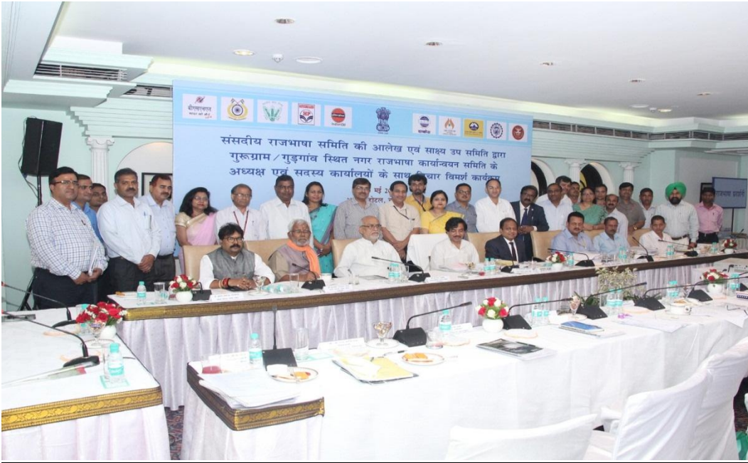
दिनांक 26 मई 2016 को संसदीय राजभाषा समिति की आलेख एवं साक्ष्य उप समिति के साथ विचार विमर्श कार्यक्रम सम्पन्न हुआ