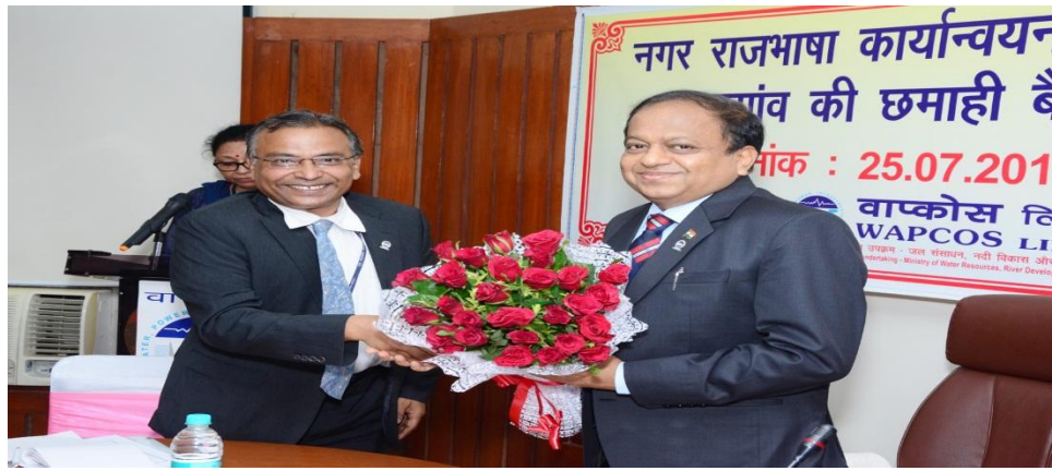
नगर राजभाषा कार्यान्वयन समिति, गुरुग्राम की वर्ष 2017 की प्रथम बैठक दिनांक 25-07-2017 को अध्यक्ष सह प्रबंध निदेशक, वापकोस एवं अध्यक्ष, नराकास की अध्यक्षता में सम्पन्न हुई