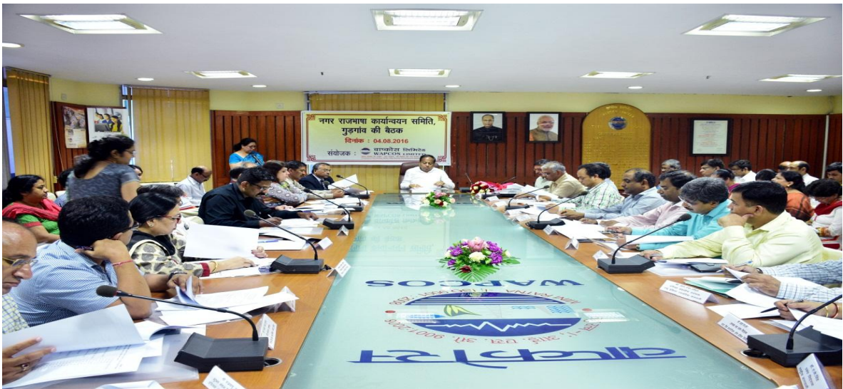
नगर राजभाषा कार्यान्वयन समिति, गुरुग्राम की वर्ष 2016 की प्रथम बैठक अध्यक्ष सह प्रबंध निदेशक, वापकोस एवं अध्यक्ष, नराकास की अध्यक्षता में सम्पन्न हुई