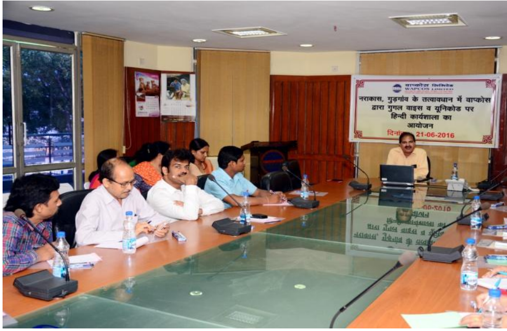
दिनांक 21-6-2016 को 'गूगल वाइस' पर आयोजित हिन्दी कार्यशाला सम्पन्न हुई