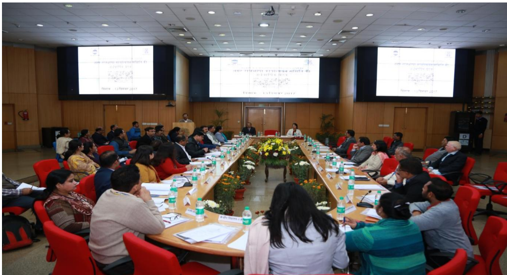
नगर राजभाषा कार्यान्वयन समिति, गुरुग्राम की दूसरी बैठक दिनांक 13-12-2018 को पावर ग्रिड कॉर्पोरेशन ऑफ इण्डिया लिमिटेड में सम्पन्न हुई