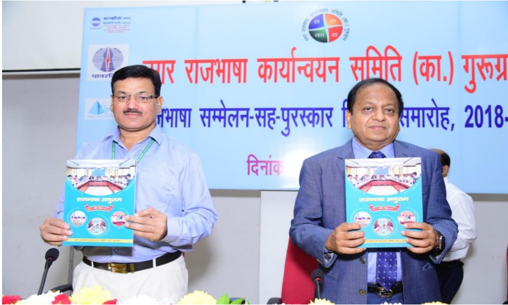
नराकास, गुरुग्राम पत्रिका 'राजभाषा अनुराग' का विमोचन